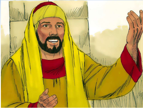
有錢年青的官 (路加十八章)