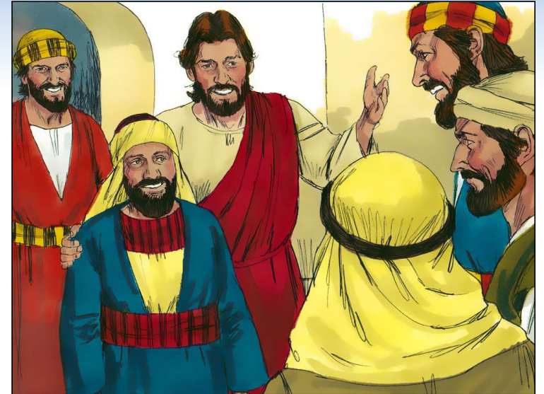
有錢的稅吏撒該 (路加十九章)